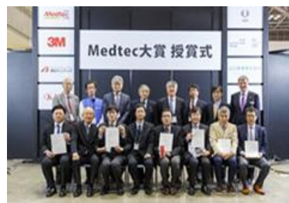
2018年 Medtec イノベーション大賞 授賞式

同賞は、「日本の技術をいのちのために委員会」の協力を得て2012年に創設したもので、今回で8回目となります。毎年、大賞1社と各部門賞(数社)を選出します。