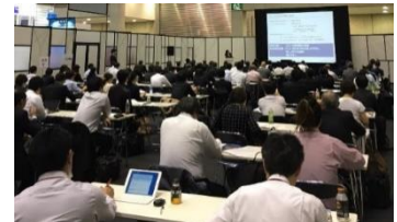
Medtec Japan 2017 セミナー

※ 同セミナーはメディアの方々も有料とさせていただきます(¥25,000)。 また、写真撮影も原則不可となっておりますので、予めご了承ください。 この他、期間中、無料セミナー(事前登録なし)も多数開催しています。