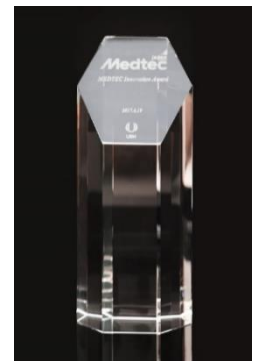
Medtec イノベーション大賞トロフィー