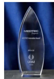
MEDTEC 大賞 トロフィー

「MEDTEC イノベーション大賞」HP: http://www.medtecjapan.com/ja/medtec_innovation_award